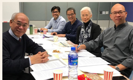
中譯本工作小組攝於公教進行社

文件接著便集中討論在改革運動時期主要的神學爭論議題，亦是馬丁路德的四個重要神學主題，即稱義、聖餐、聖職，以及聖經與傳統。每個主題均循三個步驟進行論述：首先是介紹馬丁路德對該主題的觀點，