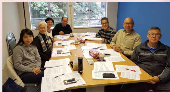
中譯本工作小組攝於信義樓會議室

《從衝突到共融》文件雖然是信義宗和天主教對談的成果，但當中論及的改革運動歷史、神學爭論議題、過去各自的觀點以至現在的立場，正是基督新教信徒所關心並期望加深認識和了解的！在紀念教會改革運動五百周年的同時，這文件實在值