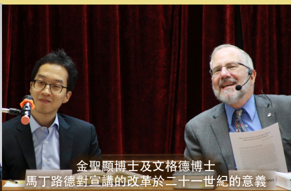
金聖顯博士及文格德博士 馬丁路德對宣講的改革於二十一世紀的意義