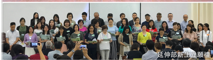
延伸部新生立願禮