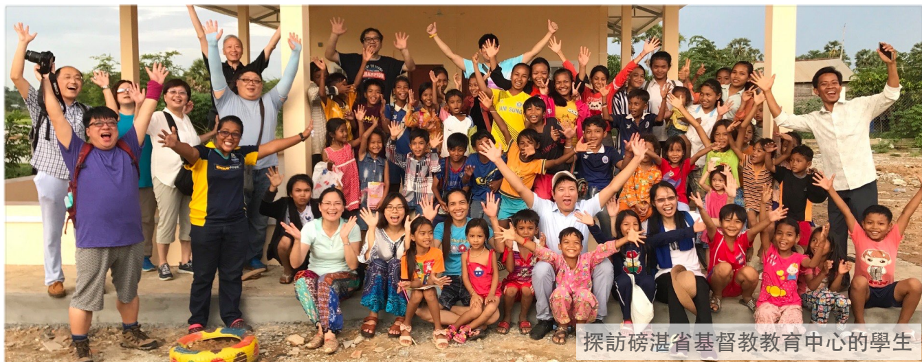
探訪磅湛省基督教教育中心的學生