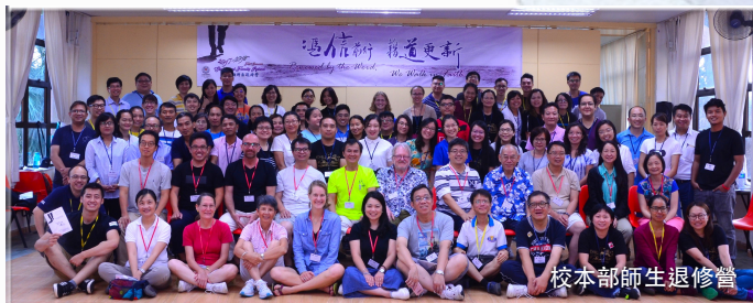
校本部師生退修營