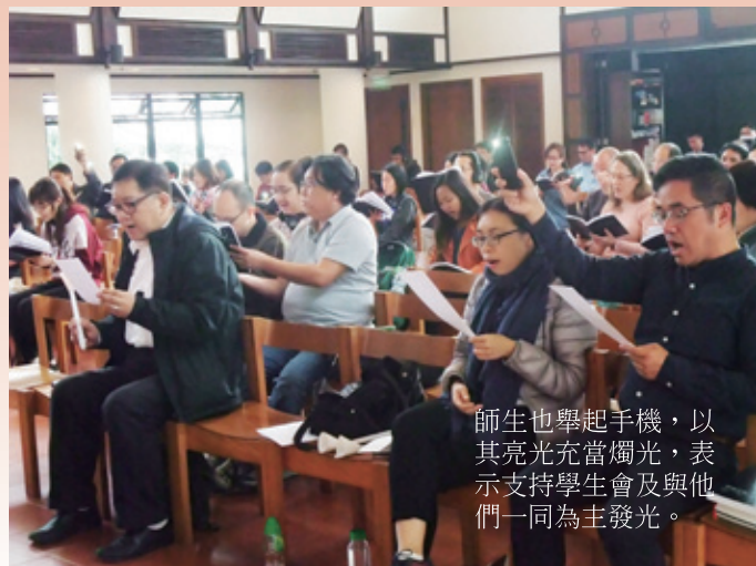
師生也舉起手機，以其亮光充當燭光，表示支持學生會及與他們一同為主發光。