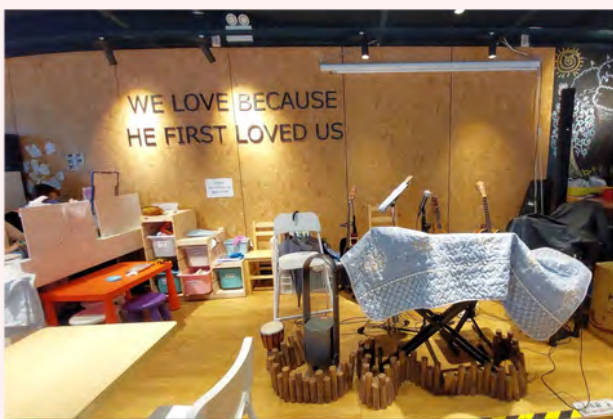
嗎哪餐廳的一角，既是敬拜也是服侍孩子之地。

過往因為同工人手有限，在安排義工上較為鬆散，因為統籌大量義工也不是容易的事，現在社關隊人手較以往充足，在同工人手分配上，除了有專注事工發展的同工，也可以安排同工處理行政事項。現在，同工人手較為充裕，他們計劃與教會合作，邀請教會內的青少年成為義工。期望安排義工接觸有需要的對象不只是一次服侍，而是可以參與一年，每月都會有一次的委身服侍。因為單次服侍，容易令服務對象感到好像「被消費」，這與機構注重同行關係的核心信念相違。另外，未來希望可透過音樂、體育、藝術、廚藝，將福音及生命陶造放在其中，帶給小朋友或其他受惠人。除了以上項目，嗎哪亦計劃籌備宿舍幫助更新人士，協助他們適應，重投社會。即使是第二里路，嗎哪的扶貧、同行初心依然不變。