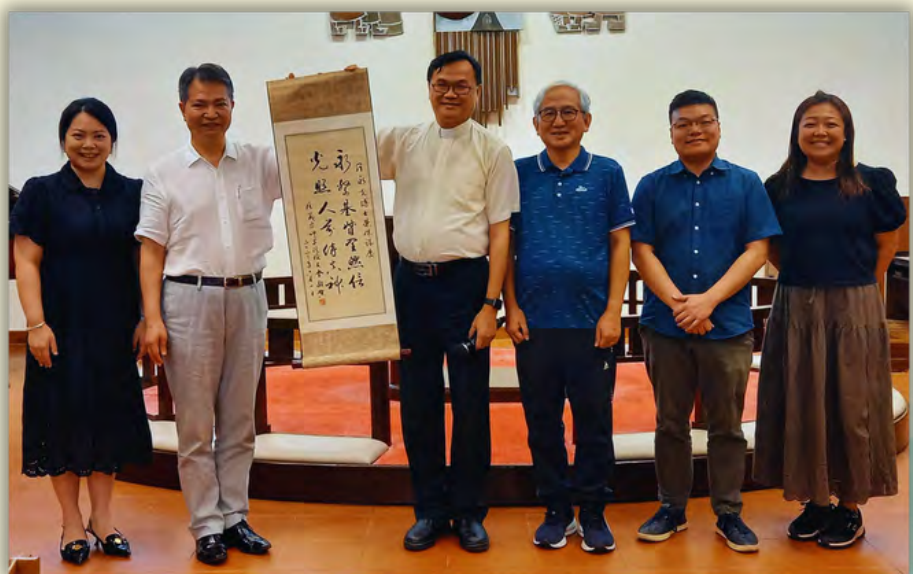
在羅博士的歡送會中，校友會職員與羅博士合照，並送上禮物，以表心意！