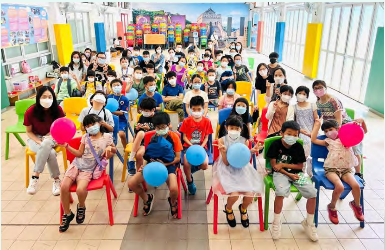
胡牧師希望孩子在耶穌裡長大，未來能成為新牧人。

縱然我仍有很多軟弱不足，但《哥林多後書》12章9節說：「他對我說：『我的恩典是夠你用的，因為我的能力是在人的軟弱上顯得完全。』」所以，我更喜歡誇耀自己的軟弱，好使基督的能力覆庇我。」這全然是上帝的恩典與帶領，也是我生命中的祝福。我是主的使女，願主的旨意成就，求主幫助。阿們。