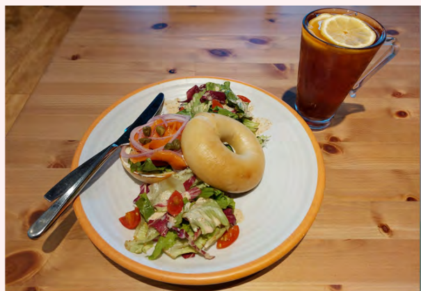
嗎哪最初目的是開餐廳。